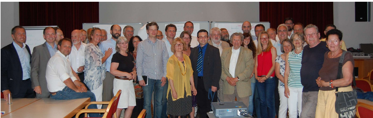
Gruppenfoto und alle anderen Fotos der Workshops – NÖ Regional GmbH

Am 23. September fand eine Abschlussbesprechung bezüglich der Leitbilderarbeitung mit der politischen Steuerungsgruppe statt. Hier wurden die Ergebnisse der drei Workshops erörtert und mit den Plänen der Stadtgemeinde zusammengefügt. Eine Präsentation des neuen Stadterneuerungskonzepts ist für den 19. November geplant. Der Beschluss des Stadterneuerungskonzeptes 2.0 durch den Gemeinderat soll am 1. Dezember erfolgen.