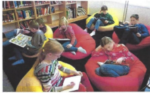
Otto Schott Gymnasium, Mainz, Gonsenheim