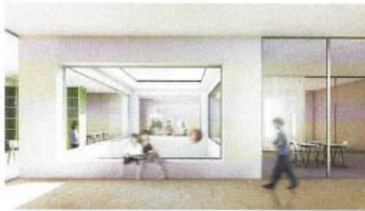
Primarschule Renens, Herzog Architekten