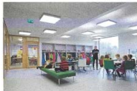
Verstas Architects, Saunalathi School, Finland Modus

Benutzung von Mehrzweckräumen um einen Teil des zusätzlichen Flächenbedarfs abzudecken. Die zentralen Pausenflächen im 1. und 2. Obergeschoss sind mit leicht beweglichen und abschließbaren Schrankpaneelen akustisch trennbar. Die dadurch entstandenen Räume können während der Vormittagsunterricht als Bibliothek, Leseecke, Musikzimmer, Filmausführung etc. und in der Nachmittagsbetreuung von weiteren zwei Hortgruppen des Hortes 2 benutzt werden.