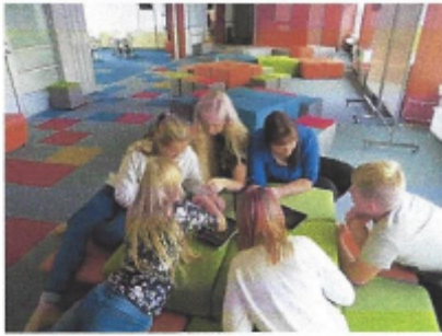
Verstas Architects, Saunalathi School, Finland