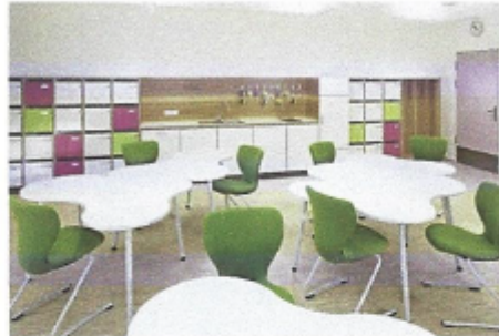
Grundschule Klein Flottbeker Weg, Trapez Architektur Hamburg

um einen Mehrzweckraum zu schaffen. Dieser Mehrzweckraum soll als Speisesaal mit Aufwärmküche für Hort- und Ganztagskinder dienen. Der Raum soll mit leicht verschiebbarem Mobiliar ausgestattet werden und nach der Speisezeit für zwei Hortgruppen als Aufenthaltsraum dienen. Die natürliche Belichtung und Belüftung soll über sogenannte Tageslicht-Spots erreicht werden.