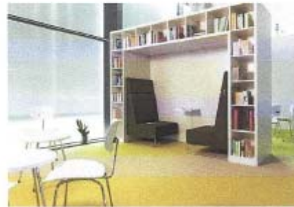
VS -Schulmöbel