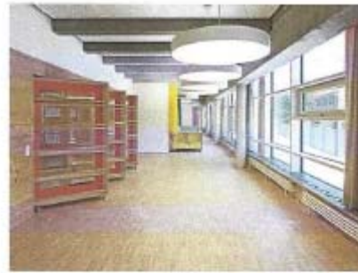
Grundschule Klein Flottbeker Weg, Trapez Architektur Hamburg

Umbau der Bibliothek zum Lehrerzimmer mit folgenden Funktionen: Teambesprechung/Beratung/Konferenz, informelle Kommunikation, Unterrichtsvor- und - Nachbereitung und Ablage von Unterrichtsmaterialien für die Lehrer zu ermöglichen und Umbau des Lehrerzimmers zum Pausenraum um einen Ruhe- und Rückzugsort, sowie eine Ablage persönlicher Sachen der Lehrkraft zu schaffen.