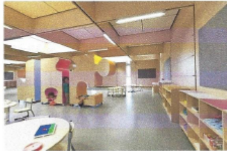
JSRACS Kindergarten in Australia

Klassenräume "Plus" erschaffen - die Klassenzimmer durch eine spürbare optische Vergrößerung zum Flur und untereinander zu erweitern. Trotz akustischer Trennung wird eine räumliche Kontinuität entstehen und die Erschließungsfläche kann als "Lernflur" eingebunden werden. Das täglich benutzte Lehrmaterial soll in den Klassenzimmern bzw. im Kellergeschoss in einem zentralen Lehrmateriallager untergebracht werden. Die neu entstandenen freien Räume an Flurenden sind als Arbeitsplätze mit Mehrfachnutzung für Teamarbeit/Sonderunterricht/Gruppenraum und teilweise Pausenflächen für Personal zu benutzen.