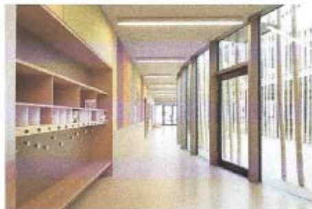
Architects, Preschool, Bolzano-Italien

Multifunktionale Nutzung von Erschließungsflächen und Flurbereichen um pädagogisch qualifizierte Kommunikations- und Differenzierungsflächen auszuweisen. Mit passender Möblierung können die Erschließungsflächen vor dem Klassenzimmer als Garderoben und kleine Gruppenräume für die Teamarbeit benutzt werden.