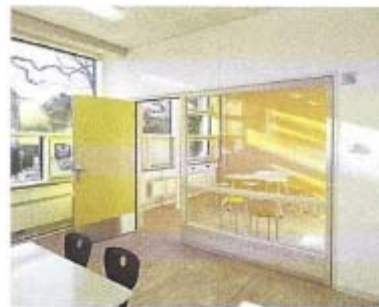
Grundschule Klein Flottbeker Weg, Trapez Architektur Hamburg

Multifunktionale Nutzung von Erschließungsflächen und Flurbereichen um pädagogisch qualifizierte Kommunikations- und Differenzierungsflächen auszuweisen. Mit passender Möblierung können die Erschließungsflächen vor dem Klassenzimmer als Garderoben und kleine Gruppenräume für die Teamarbeit benutzt werden.